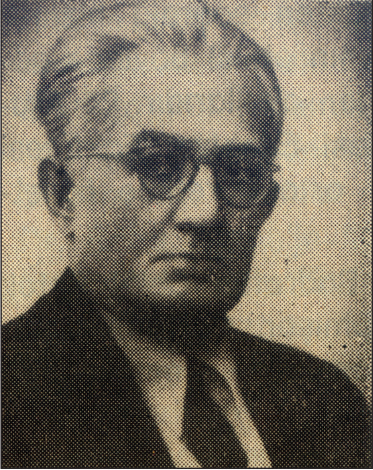
SADRETTİN CELAL ANEL (1890-12 Şubat 1954)